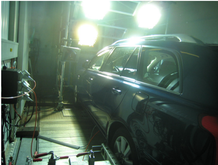
Bild 3: Ein Fahrzeug wird im Klimaprüfstand der Empa bei hoher Temperatur, Feuchte und Sonneneinstrahlung getestet.