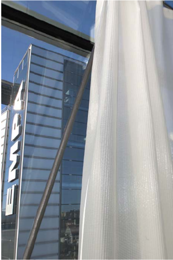
Der neue schallabsorbierende Vorhang im «Einsatz» in einem Seminarraum an der Empa in St. Gallen